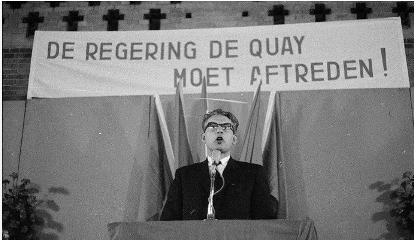
Marcus Baker houdt een 1 mei toespraak in Felix Meritis, 1962

Nadat de communist in 1956 voor de CPN geïnstalleerd werd als lid van de Tweede Kamer liep de zaal leeg. Maar Marcus Bakker ontwikkelde zich gaandeweg tot een begrip, een man die tevens op termijn de begane misdaden door de Sovjet-Unie benoemde.