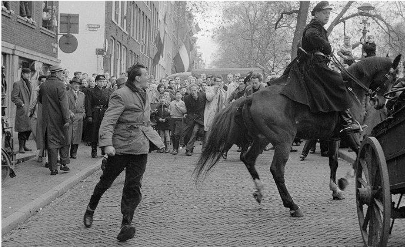
Volkswede bij het kantoor van de CPN nadat de Russen Hongarije waren binnengevallen in 1956

verhinderen dat een deel van het middenkader ook het stalinisme binnen de eigen partij bekritiseerde.