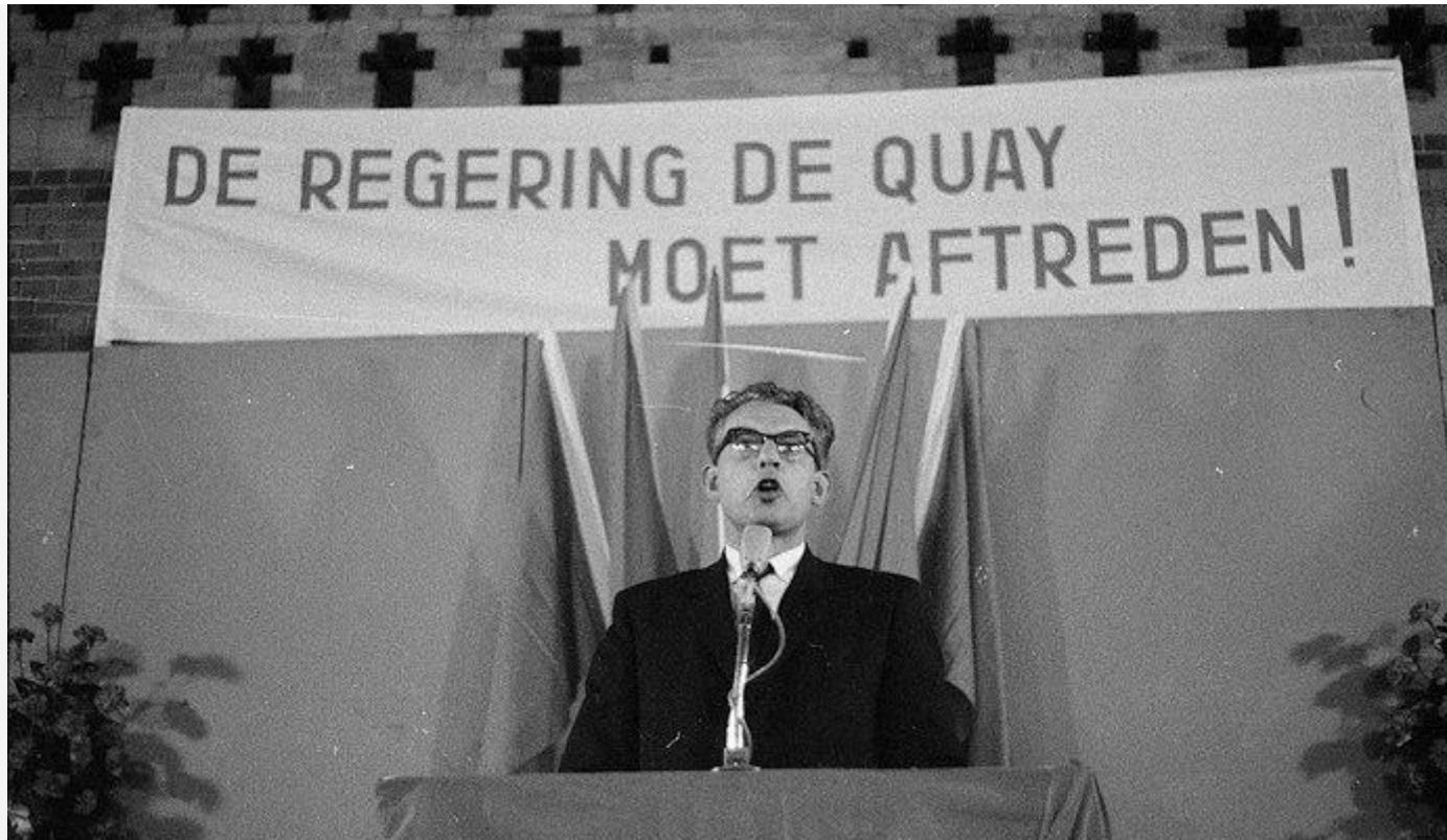
Marcus Baker houdt een 1 mei toespraak in Felix Meritis, 1962

Nadat de communist in 1956 voor de CPN geïnstalleerd werd als lid van de Tweede Kamer liep de zaal leeg. Maar Marcus Bakker ontwikkelde zich gaandeweg tot een begrip, een man die tevens op termijn de begane misdaden door de Sovjet-Unie benoemde.